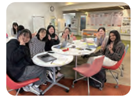
ဂျပန်စာ လေ့လာသူ များအဖွဲ့ 日本語コミュニティ