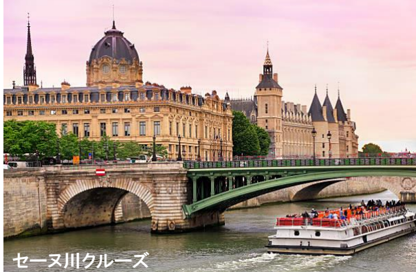
セーヌ川クルーズ

↑所蔵美術品 38 万点が広大な館内に展示され年間の入場者数は 1 千万人を越え、まさに世界一の美術館。「モナ・リザ」、「ミロのヴィーナス」、「サモトラケのニケ」等誰でも知っている名作絵画がいたるところに。昨年公開映画「岸边露伴 ルーヴルへ行く」の舞台