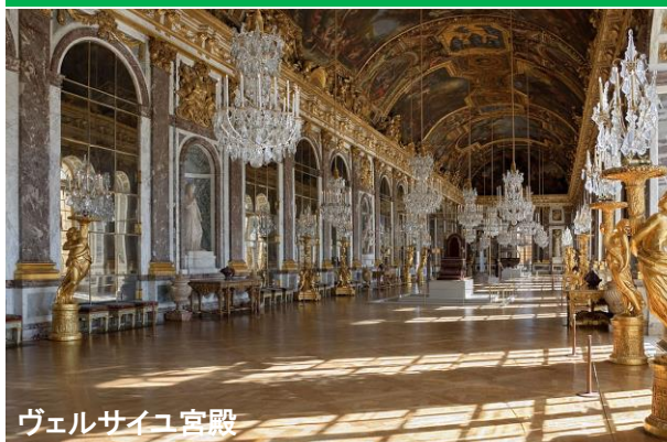
ヴェルサイユ宮殿

→ルイ14世が建造した、世界で最も豪華な世界遺産の王宮。マリーアントワネットの婚礼舞踏会も行われた華やかな装飾が施された鏡の間は必見。